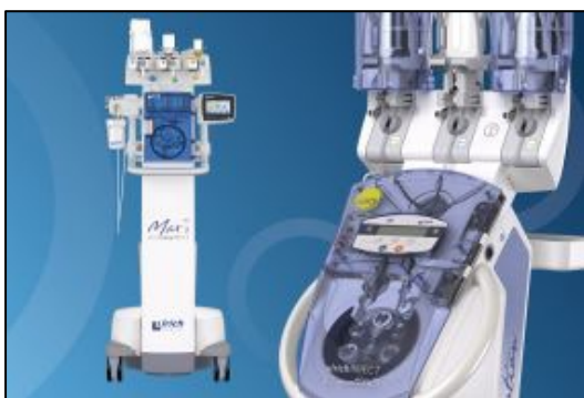
Bild 1: Ein wesentlicher Treiber des letztjährigen Umsatzplus bei Ulrich Medical war der Bereich der Kontrastmittelinjektoren für CT und MRT.

(Achtung, nur Bildschirmauflösung. Druckauflösung anfordern unter ulrichmedical@pr-hoch-drei.de .)