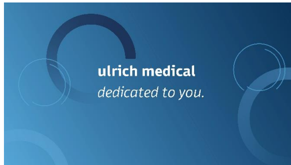
Bild 3: L'image de marque d'Ulrich Medical avec le message "dedicated to you".